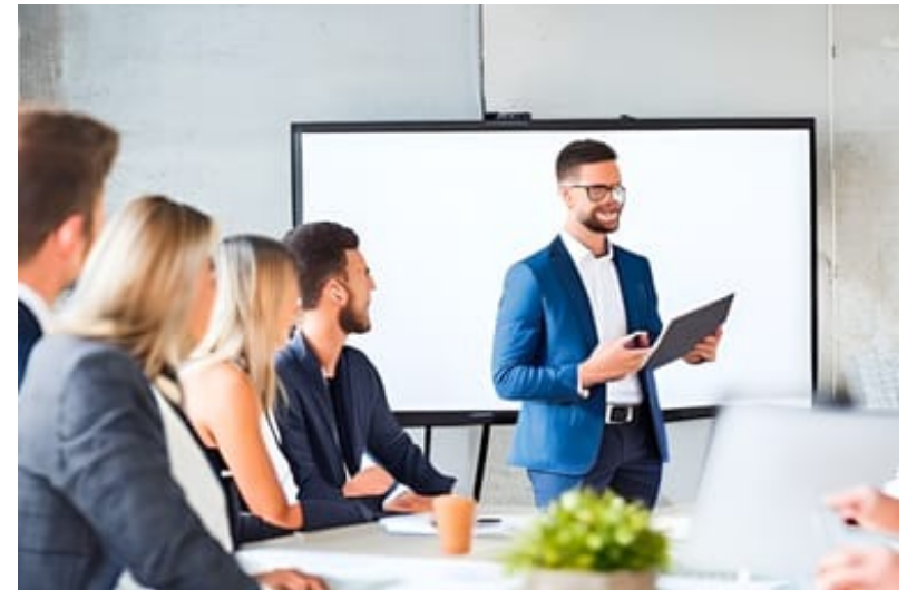
イメージ図 (AI Picasso)