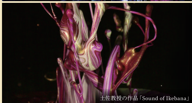
土佐教授の作品「Sound of Ikebana」